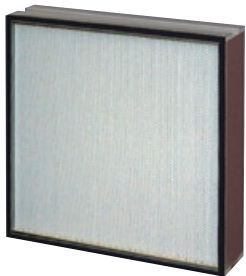
内蔵されているHEPAフィルタ